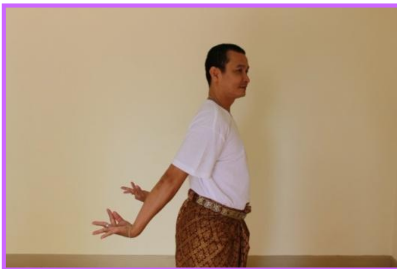
ภาพที่ 17 จีบส่งหลังด้านข้างตัวพระ