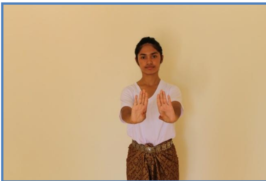
ภาพที่ 9 วงหน้าตัวนาง