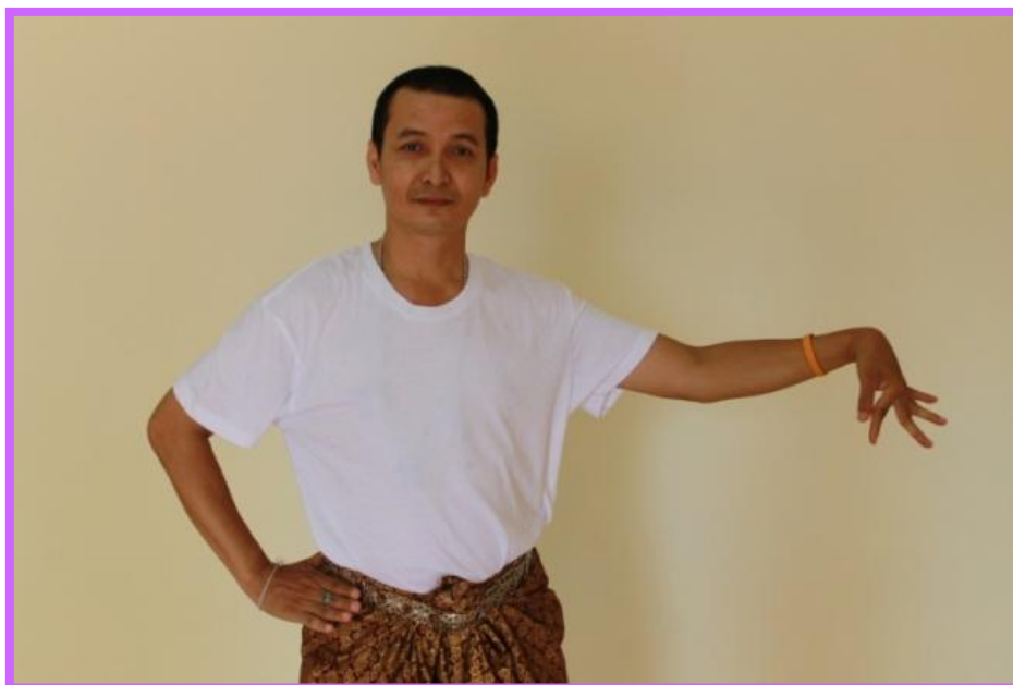
ภาพที่ 15 จีบคว่ำตัวพระ