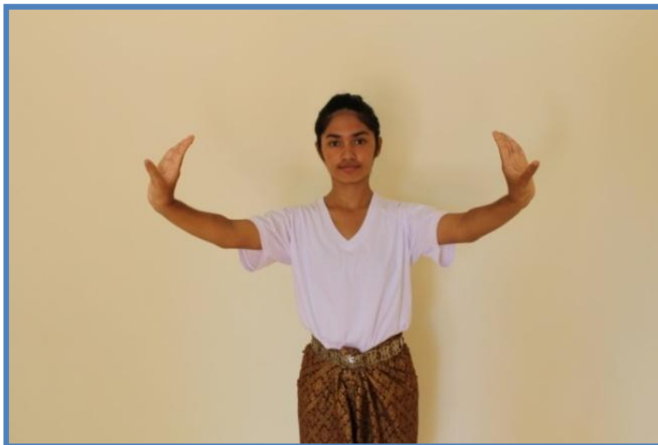
ภาพที่ 3 วงบน ตัวนาง