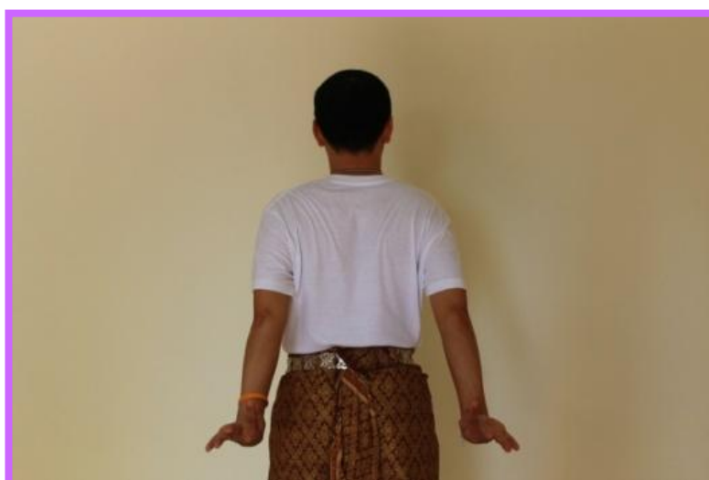
ภาพที่ 18 จีบส่งหลังด้านหลังตัวพระ