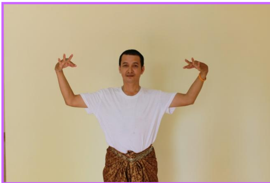
ภาพที่ 21 จีบปรกข้างตัวพระ