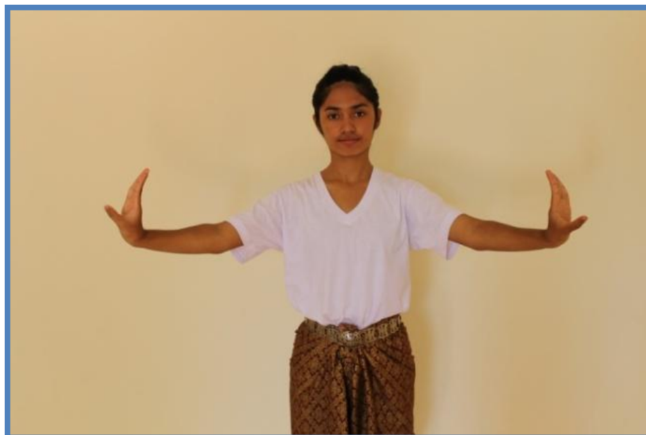
ภาพที่ 5 วงกลางตัวนาง