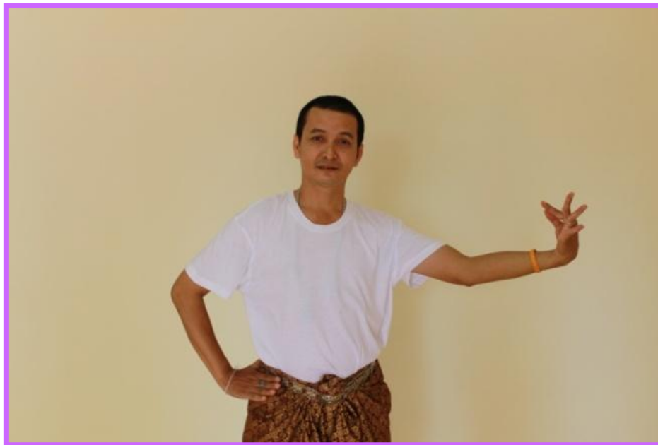
ภาพที่ 13 จีบหงายตัวพระ