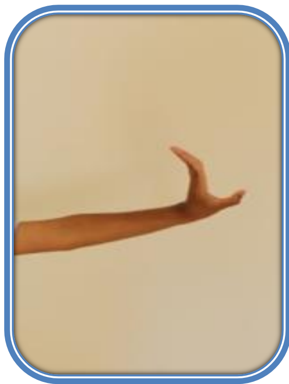
ภาพที่ 1 วง