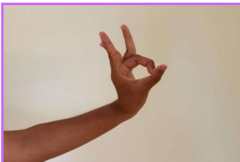
ภาพที่ 32 จีบล่อแก้ว ต้วนาง