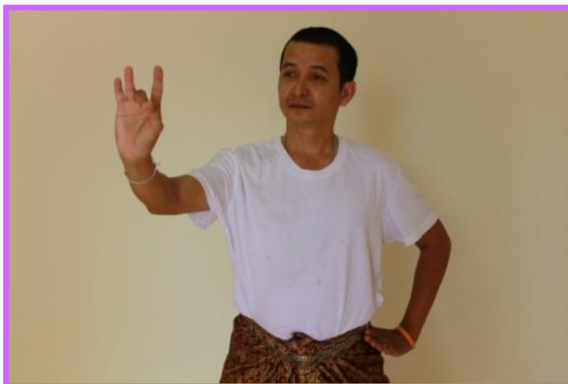
ภาพที่ 29 จีบล่อแก้วตัวพระ