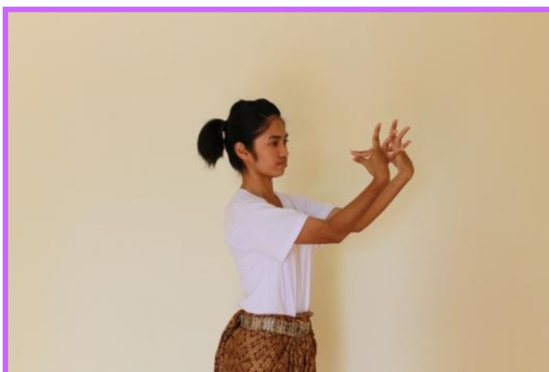
ภาพที่ 26 จิบปรกหน้าด้านข้างตัวนาง