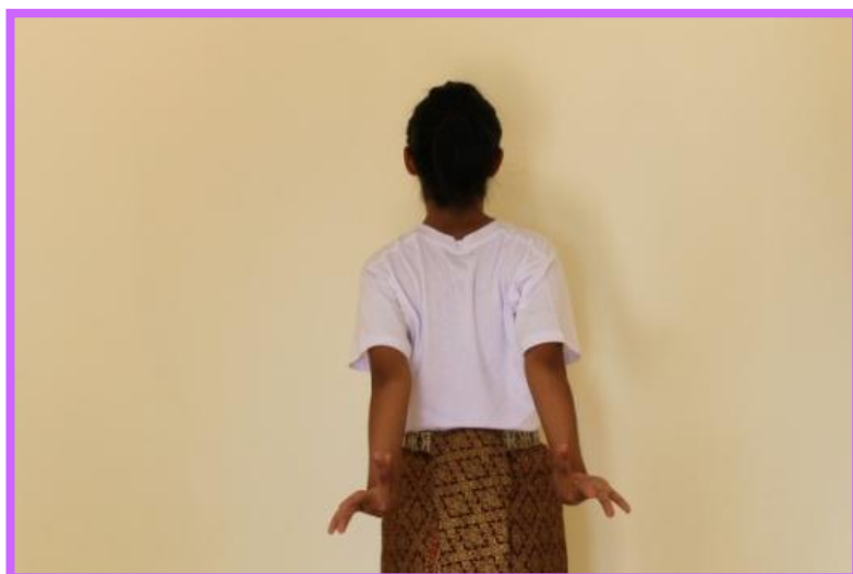
ภาพที่ 20 จีบส่งหลังด้านหลังตัวนาง