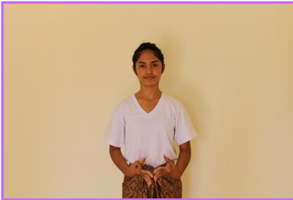
ภาพที่ 28 จีบหงายชายพกตัวนาง