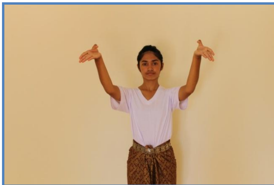
ภาพที่ 11 วงบัวบานต้วนาง ที่มา : เเบญจมาภรณ์ พุ่มไสว (2554)