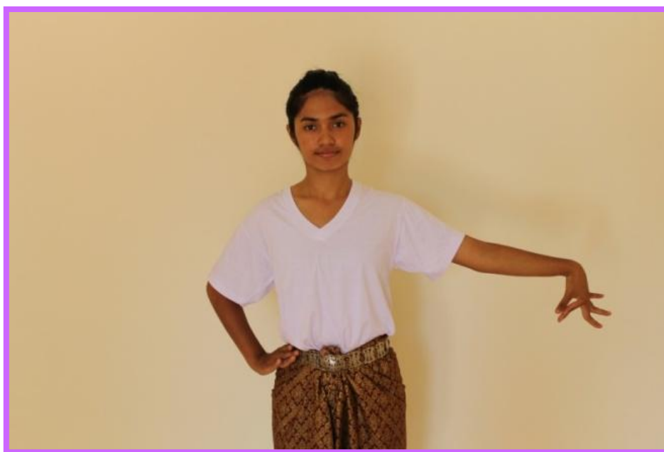
ภาพที่ 16 จีบคว่ำตัวนาง