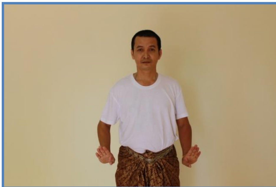
ภาพที่ 6 วงล่างตัวพระ