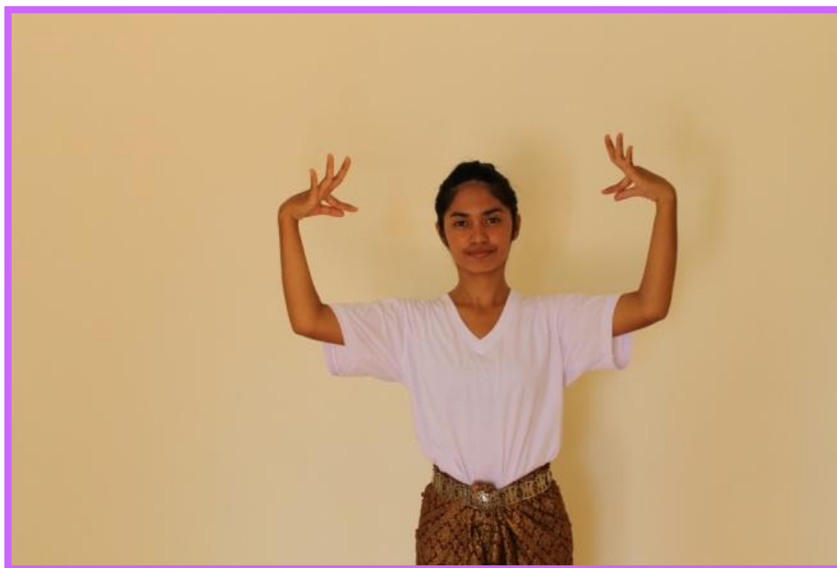
ภาพที่ 22 จีบปรกข้างตัวนาง