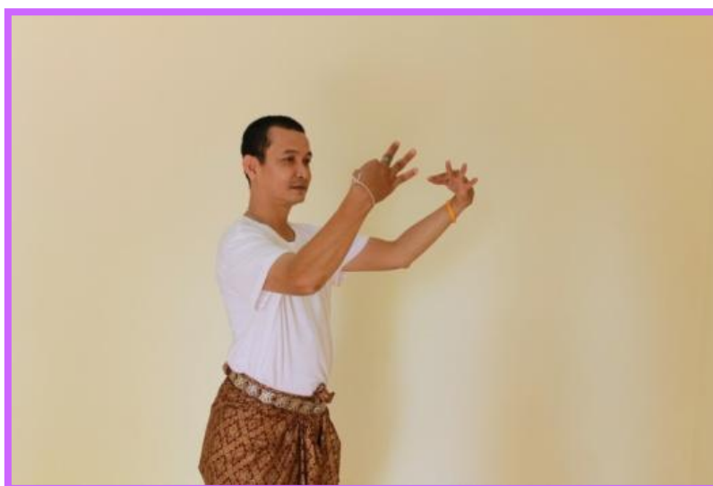
ภาพที่ 24 จิบปรกหน้าด้านข้างตัวพระ ที่มา : เบญจมาภรณ์ พุ่มไสว (2554)