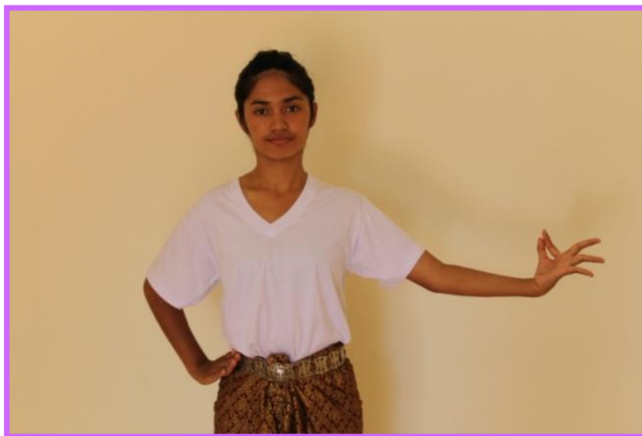
ภาพที่ 14 จีบหงายต้วนาง