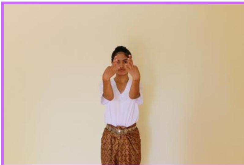
ภาพที่ 25 จิบปรกหน้าด้านหน้าตัวนาง