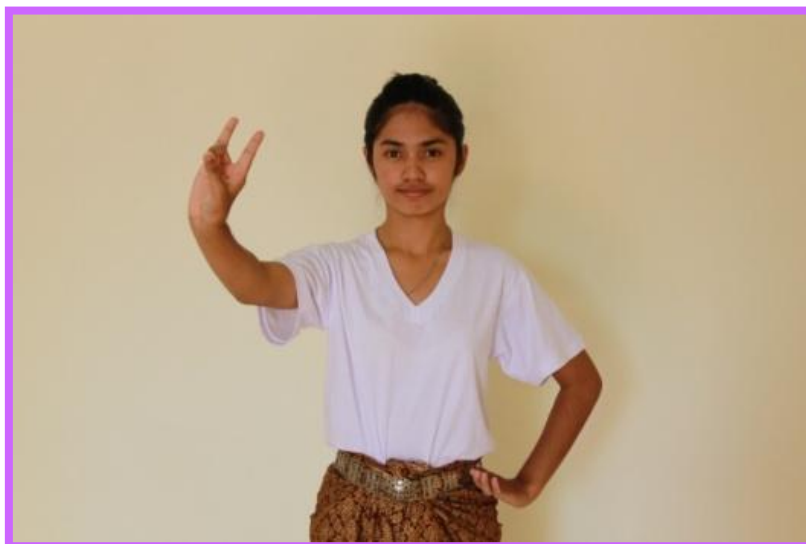
ภาพที่ 31 จีบล่อแก้ว ต้วนาง