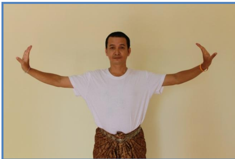
ภาพที่ 2 วงบน ตัวพระ