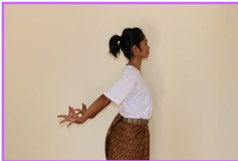
ภาพที่ 19 จีบส่งหลังด้านข้างตัวนาง