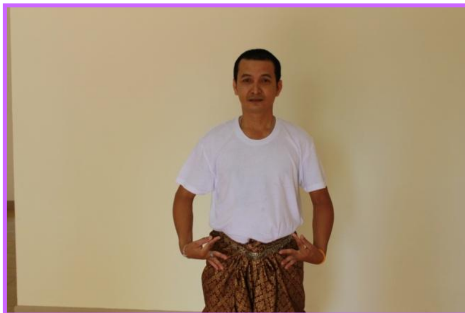
ภาพที่ 27 จีบหงายชายพกตัวพระ