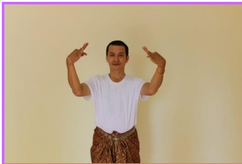
ภาพที่ 23 จิบปรกหน้าด้านหน้าตัวพระ