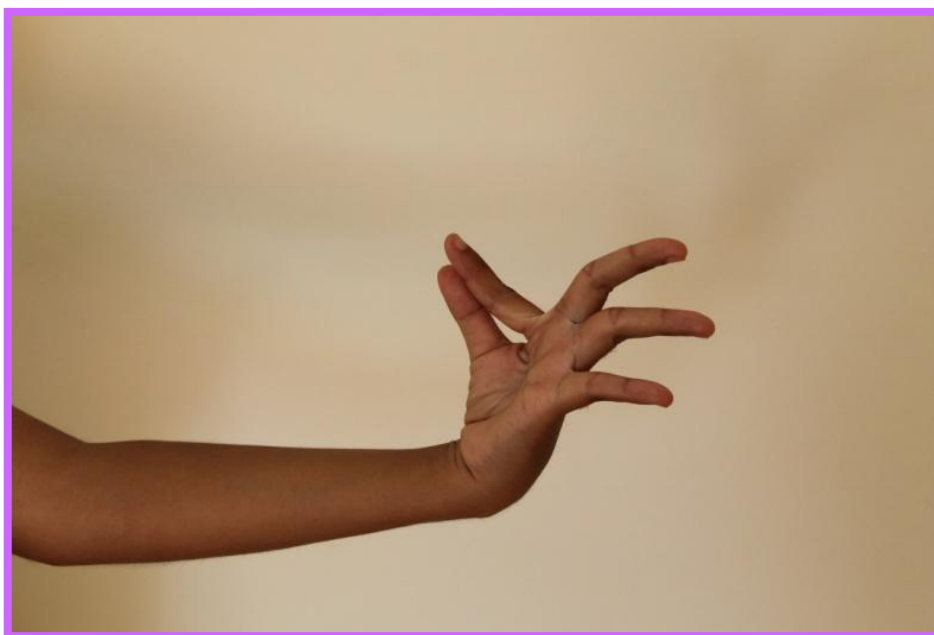
ภาพที่ 12 จิบ