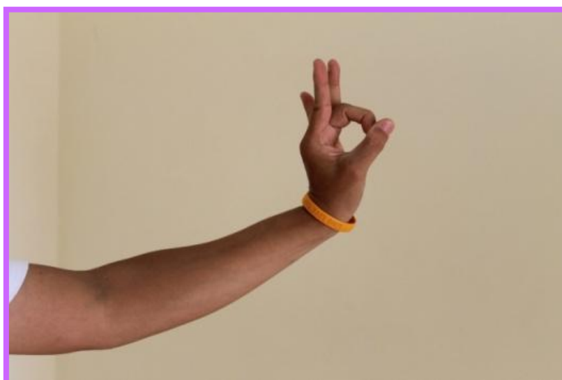
ภาพที่ 30 จีบล่อแก้วตัวพระ ที่มา : เบญจมาภรณ์ พุ่มไสว (2554)