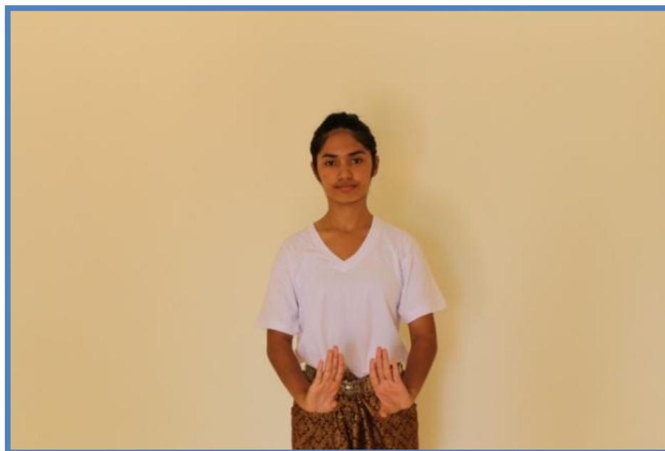
ภาพที่ 7 วงล่างตัวนาง